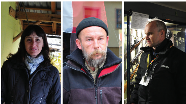
fol. P. Dymiński