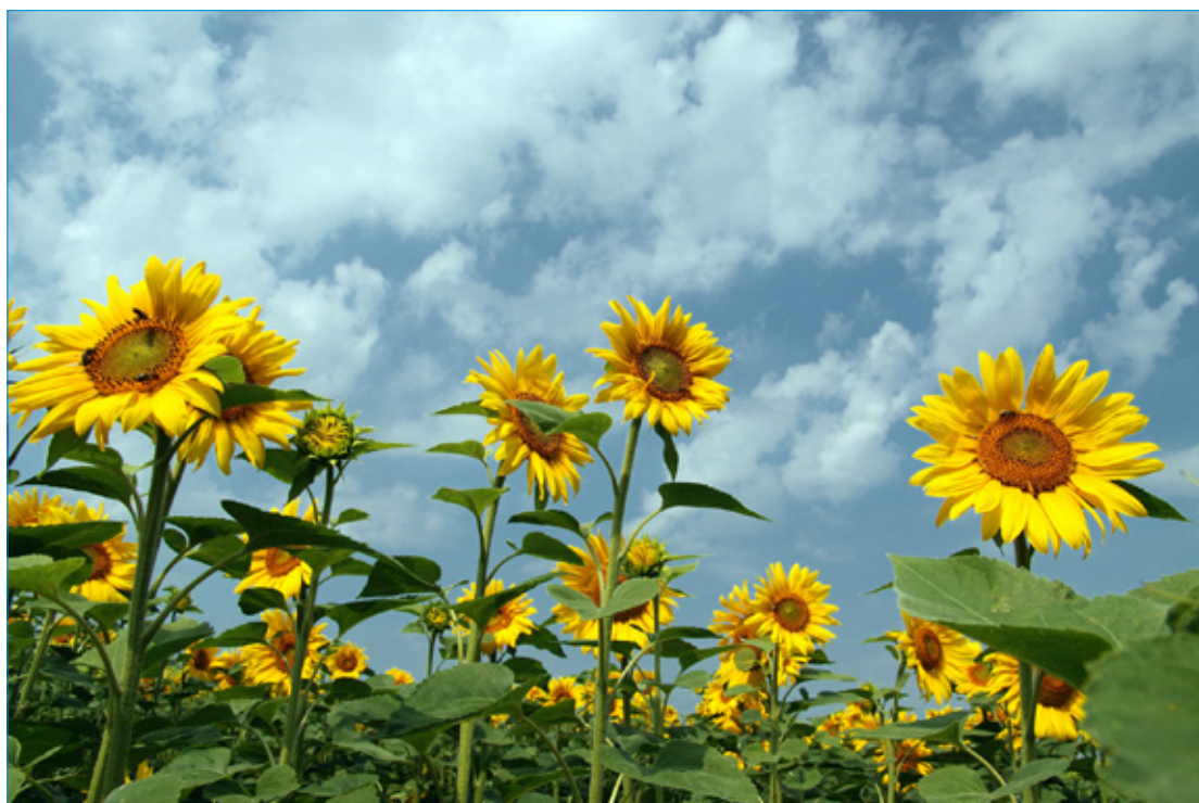
Beskid Niski. Plantacja słoneczników