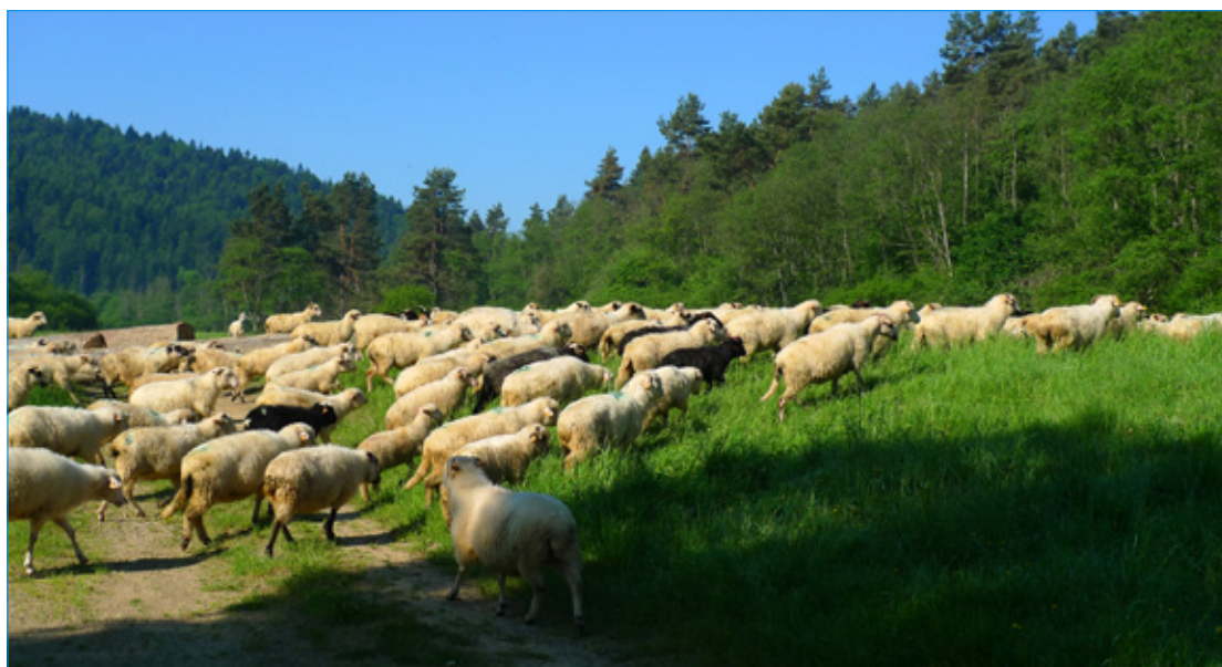
Beskid Niski. Wypas owiec