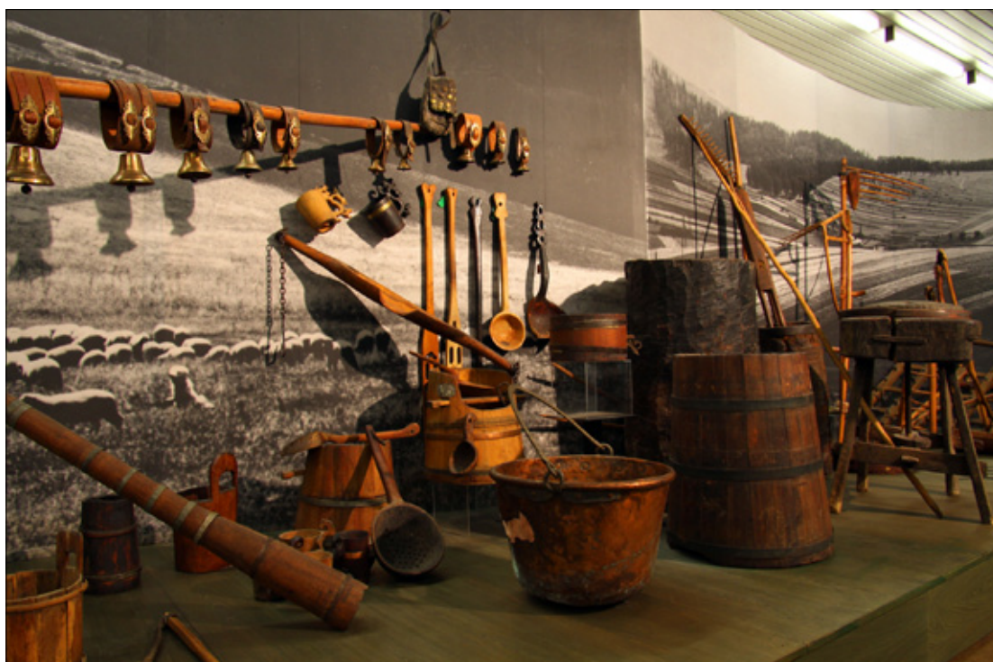
Svidnik - muzeum

Hronu, Zwoleńska). Do ważniejszych masywów należą: Wielka Fatra, Mała Fatra, Tatry Zachodnie, Tatry Wschodnie i Małe Karpaty.